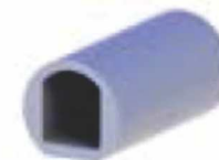
PVC čep za gornju šinu x2