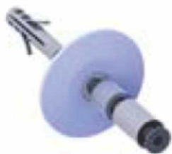
Nosači gornje šine sa šraфом x3