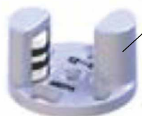
PVC Donja vodica