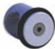
Gornji stoper x2